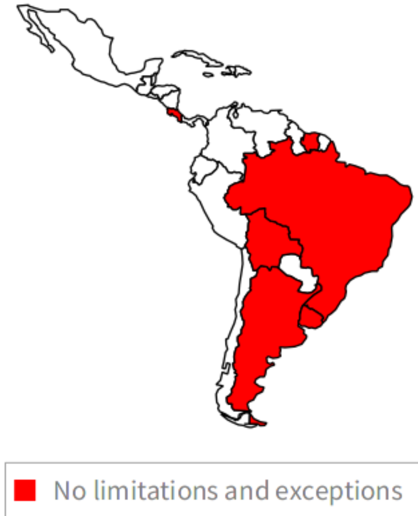
Figura 0.5: Excepciones y limitaciones del estudio Crews

El mapa muestra los países que cuentan con excepciones y limitaciones para bibliotecas y archivos. De un total de 27 países, son 21 los que cuentan con algunas excepciones y limitaciones. Los seis países en color rojo son los únicos países de América Latina y el Caribe que no cuentan con ninguna excepción o limitación en sus legislaciones.