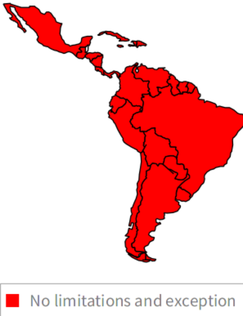
Figura 0.12: Limitación de responsabilidad para bibliotecas, archivos y sus funcionarios