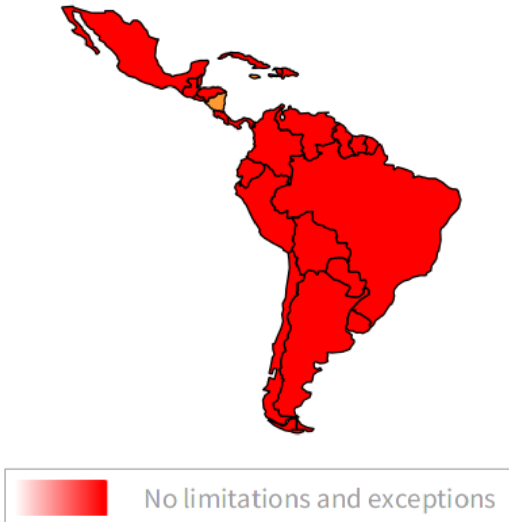
Figura 0.9: Excepciones para personas con discapacidades

De las 2 posibles excepciones la lista EIFL , ningún país cuenta con todas ellas.