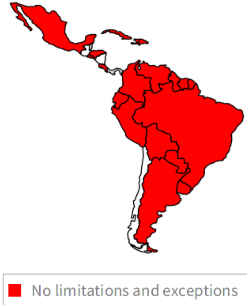
Figura 0.10: Formatos neutrales