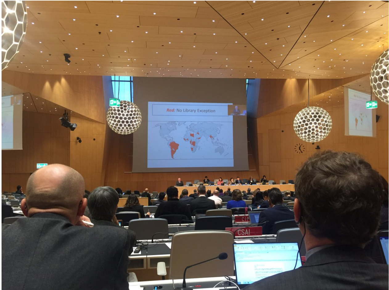
Figura 0.4: Imagen alusiva a la presentación en la OMPI del Estudio por el profesor Crews

Desde el enfoque Crews, de los 191 países, 161 de ellos tienen al menos una disposición que se aplica explícitamente a bibliotecas o archivos. Una lectura profunda al estudio ha permitido identificar que muchos países cuentan con algunas limitaciones y excepciones para bibliotecas, pero son insuficientes para cubrir las actividades misionales de bibliotecas y archivos. En este marco, hemos realizado un análisis comparativo del estudio Crews a partir de la Encuesta EIFL, una lista de verificación de excepciones para bibliotecas elaborada por Electronic Information for Libraries ( Core Library Exceptions Checklist. Does Your Copyright Law Support Library Activities And Services? que establece las disposiciones que toda ley de propiedad intelectual debería tener para apoyar el trabajo de las bibliotecas.